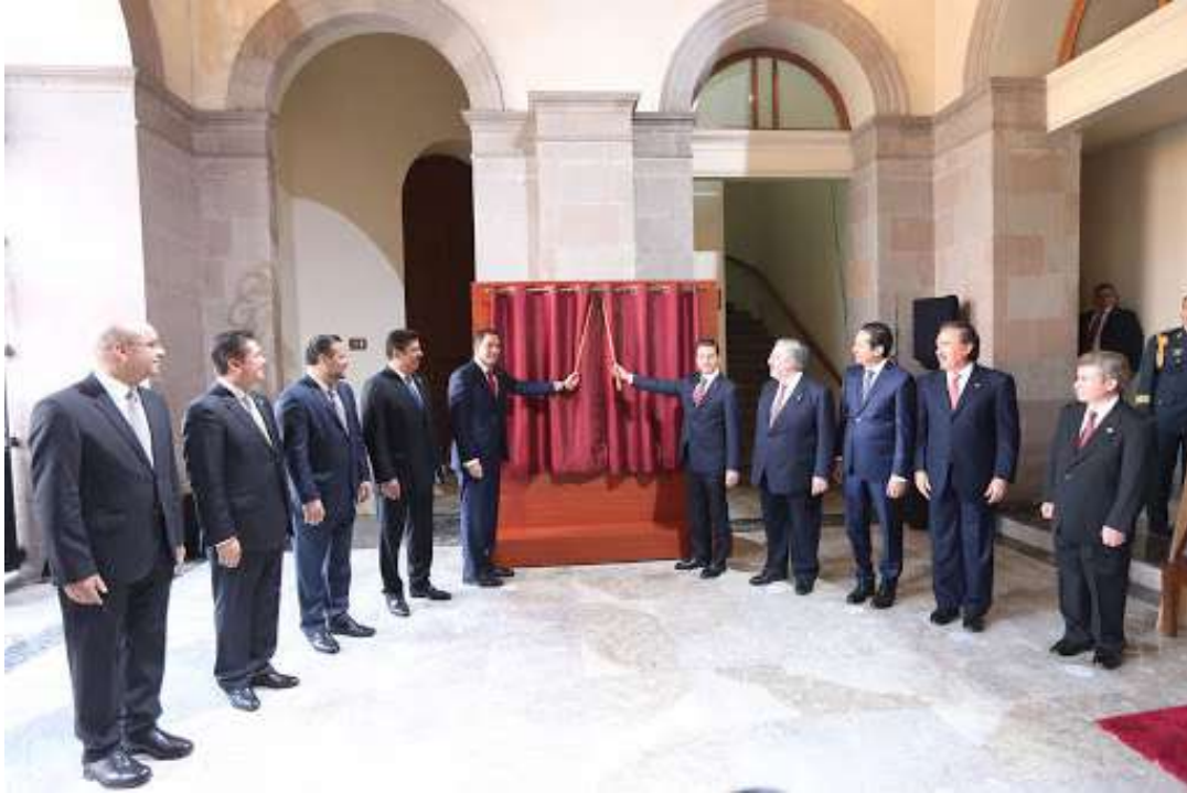
IMAGEN DE ACTO

De la misma manera, se sugiere hacer extensiva la invitación de honor para la generación de identidad a las y los servidores públicos de su administración, toda vez que son un factor clave como eje de acción y motivación con la ciudadanía.