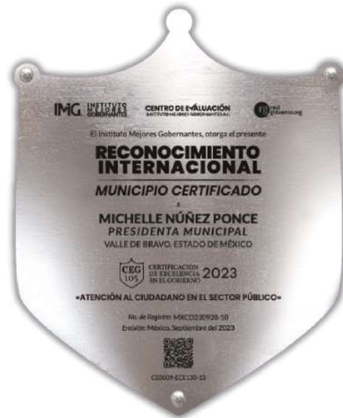
IMAGEN DE LA PLACA

De igual forma, se recomienda ubicar la Placa Oficial del Reconocimiento de Certificación de Excelencia en el Gobierno - CEG, en una zona visible para el mayor número de servidores públicos y ciudadanos. Esto, con la finalidad de que el reconocimiento funja como catalizador en el ánimo de inspiración.