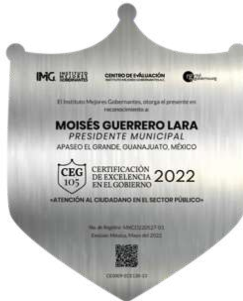
IMAGEN DE LA PLACA

De igual forma, se recomienda ubicar la Placa Oficial del Reconocimiento de Certificación de Excelencia en el Gobierno - CEG, en una zona visible para el mayor número de servidores públicos y ciudadanos. Esto, con la finalidad de que el reconocimiento funja como catalizador en el ánimo de inspiración.