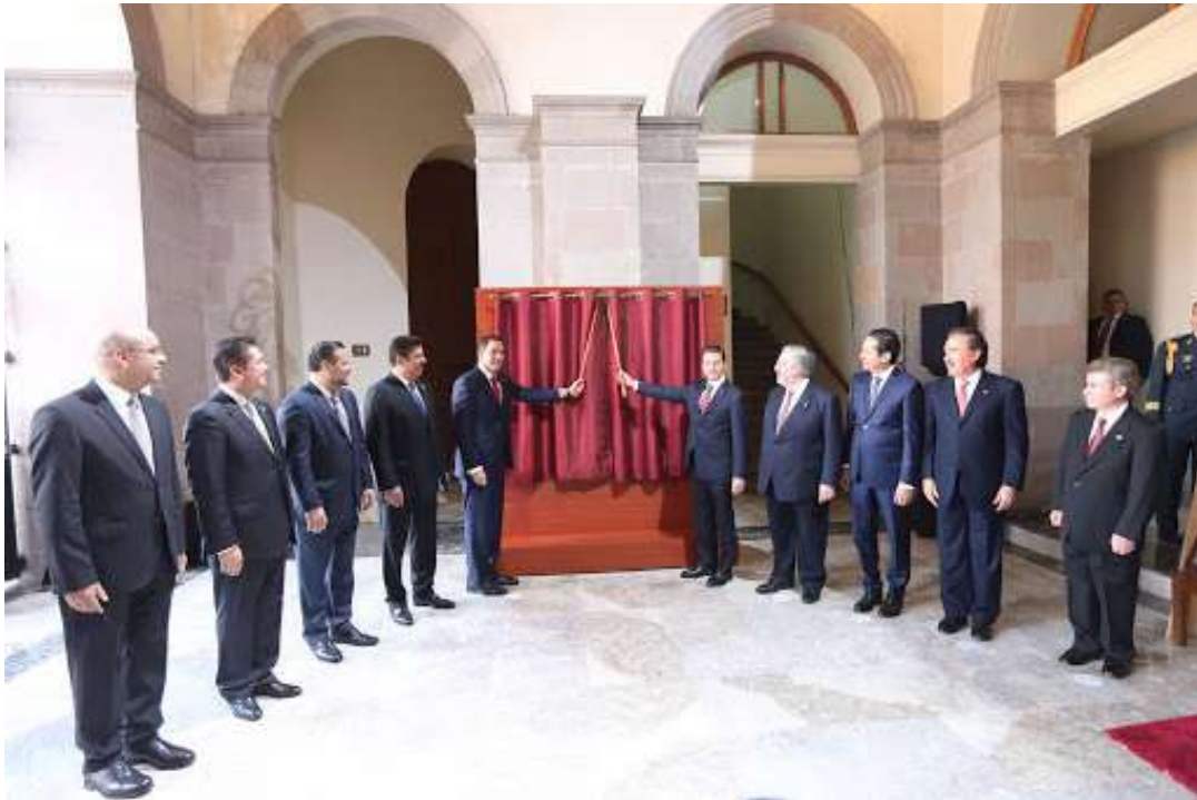
IMAGEN DE ACTO

De la misma manera, se sugiere hacer extensiva la invitación de honor para la generación de identidad a las y los servidores públicos de su administración, toda vez que son un factor clave como eje de acción y motivación con la ciudadanía.