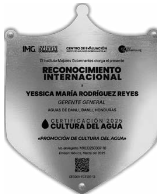
IMAGEN DE LA PLACA

De igual forma, se recomienda ubicar la Placa Oficial del Reconocimiento de Certificación de Cultura de Agua, en una zona visible para el mayor número de usuarios y servidores públicos. Con el ánimo de motivar e inspirar.