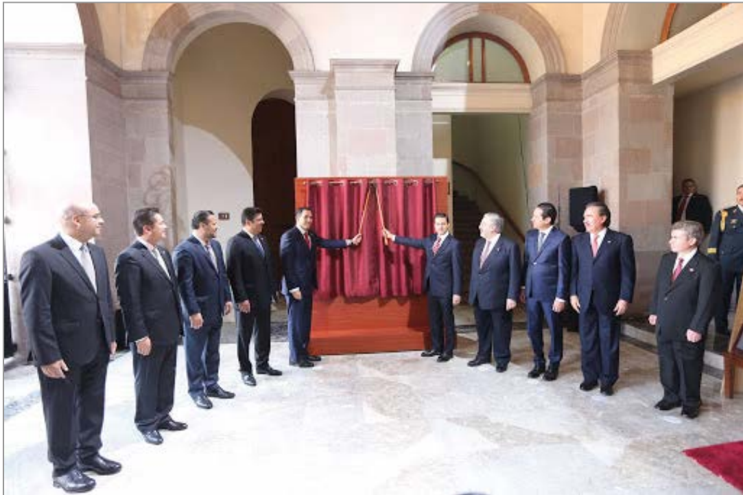
IMAGEN DE ACTO

De la misma manera, se sugiere hacer extensiva la invitación de honor para la generación de identidad a las y los servidores públicos de su administración, toda vez que son un factor clave como eje de acción y motivación de los usuarios.